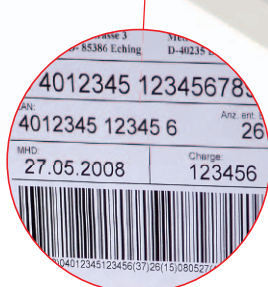
Étiquetage des cartons et des palettes