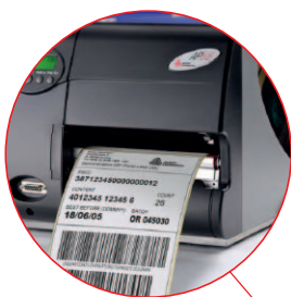
Picking et Préparation de commandes