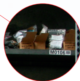
Stockage des étiquettes