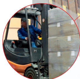
Étiquetage de gondoles