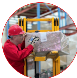
Réception de marchandises